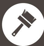
Pensel / Roller